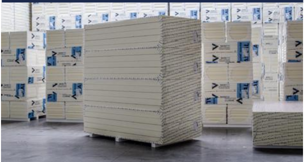
Zdjęcie_05_Stos płyty w dużym formacie