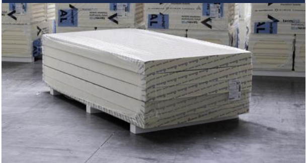
Zdjęcie_03_Paczka 1200x2400 (duży format)