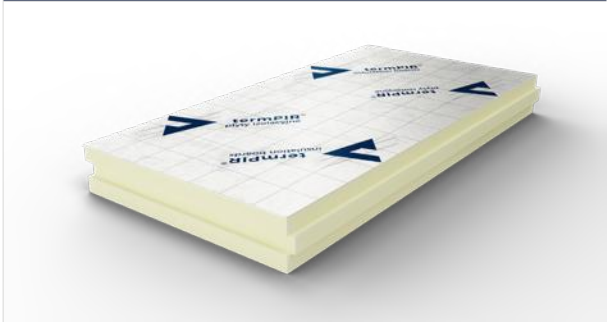
Zdjęcie_01_Przykłdowa wizualizacja jednej płyty