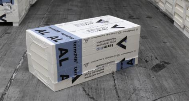
Zdjęcie_02_Paczka 600x1200 (mały format)