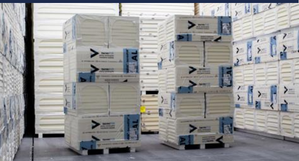
Zdjęcie_04_Stos płyty w małym formacie